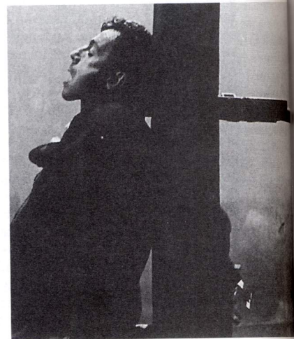
Pascual Duarte de Ricardo Franco

La projecció de Guys and Dolls ens serveix per retre un merescut homenatge a un dels seus protagonistes, Frank Sinatra (1915-1998), mort el 15 de maig. Sis dies després, de forma sobtada, moria el cineasta espanyol Ricardo Franco (1949-1998), enmig del rodatge de la seva darrera pel·lícula, Lágrimas negras . Una mort que és especialment lamentable pel fet de produir-se prematurament i en un moment en què, gràcies a l'èxit assolit l'any passat amb La buena estrella , Ricardo Franco havia pogut deixar enrere aquella fama de cineasta maleït que l'havia acompanyat sempre. El nostre homenatge és la projecció de Pascual Duarte , guardonada al Festival de Cannes. Agraïm la col·laboració d'Elías Querejeta P.C. SL. per a aquesta projecció.