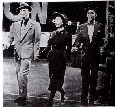
Guys and Dolls de Joseph L. Mankiewicz

És un clàssic del teatre musical de Broadway, amb música de Frank Loesser i llibret d'Abe Burrows i Jo Swerling, que Joseph L. Mankiewicz va portar al cinema només cinc anys després de la seva primera estrena teatral i que aquí coneixem amb el títol Ellos y ellas . Aquests dies s'està representant al Teatre Nacional de Catalunya en una versió molt lliure, dirigida per Mario Gas.