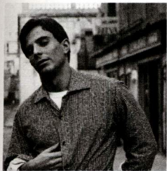
Young Sánchez (1964), de Mario Camus