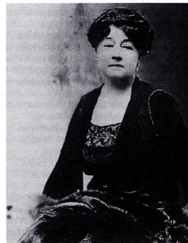
Alice Guy, pionera del cinema

ASSOCIACIÓ CATALANA DE CRÍTICS I ESCRITORS CINEMATOGRAFICS