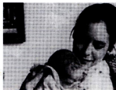
Mujer ante el espejo, de Marisol Trujillo

– Jo no estava gens polititzada, anava a les manifestacions per al Vietnam amb un coneixement molt vague de l'assumpte, però el 68 es notava individualment que la cosa era a punt de petar. Evidentment, quan ets adolescent, sempre tens ganes de fer-ho petar tot. Jo me'n volia anar, estava tipa de la vida