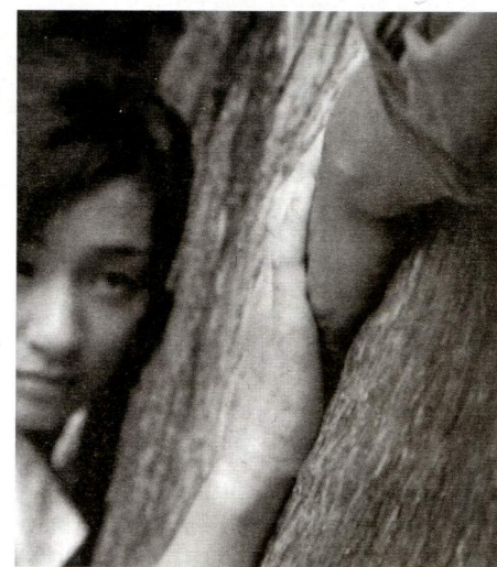
El bosque de luto de Naomi Kawase

En la secció Etnografies experimentals , Virginia Villaplana i Montse Romaní ens proposen seguir la línia discursiva iniciada a la Mostra anterior sobre les aportacions de les dones a les recents narratives del videoassaig centrades en la politització dels relats de gènere i la construcció de subjectivitats.