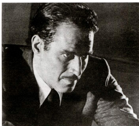
Touch of Evil d'Orson Welles

Volem recordar la figura de l'actor Charlton Heston, finat recentment, amb dos dels seus films més interessants que a més l'allunyen de la imatge habitual d'heroi en tinte color que tenim tots al cap: Touch of Evil (Orson Welles, 1958), on tingué un paper destacat en el desenvolupament del projecte, i Ruby Gentry (King Vidor, 1952), una de les seves interpretacions més reeixides. ►