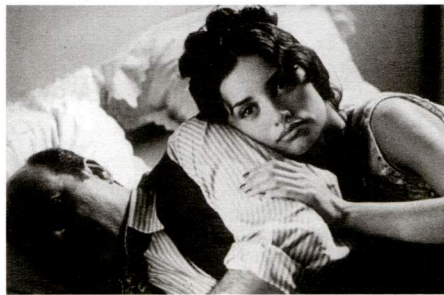
La niña de tus ojos de Fernando Trueba

El documental proposat per Paral·lel 40 per a aquest mes de juny ens apropa d'una manera força curiosa al món del futbol. La otra copa , de Damián Cukierkorn, segueix les peripècies d'un equip argentí de futbol integrat per gent sense sostre que participa en el Campionat de Futbol (també per als sense sostre) que se celebra a Suècia. Els caldrà entrenar, cercar diners per al viatge, etc... i els suposarà una oportunitat per fugir d'una vida mi-